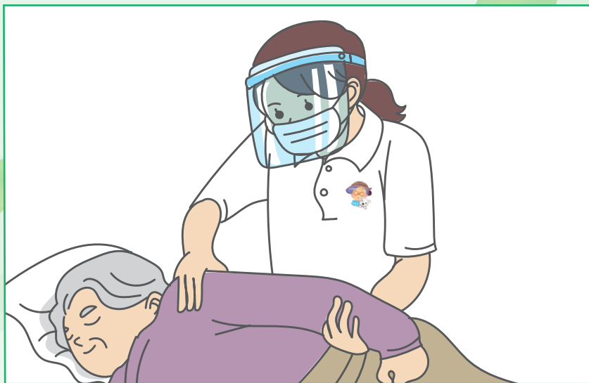
「マスク」と「フェースシールド」の着用